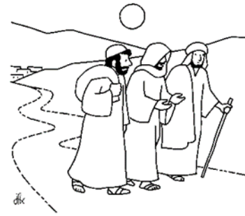
Louis Fecteau, prêtre